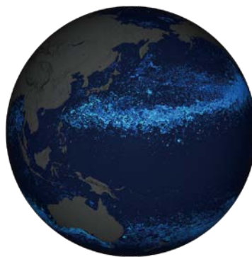
圖4、以浮標位置資料及洋流模式模擬出太平洋垃圾帶。