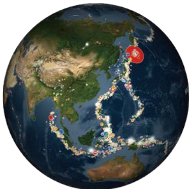
圖3、2011至2015年間發生的地震分布。

NOAA利用浮標位置資料及洋流的模式，去模擬這些位置點隨著洋流會如何移動，經過一段時間後會發現這些點會漸漸匯聚於某幾個洋面上的區塊，而以太平洋為例，匯聚的區域正好就是最近發現的太平洋垃圾帶的所在處。